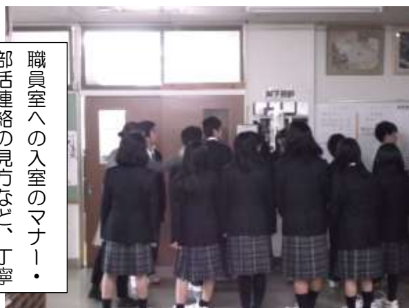
職員室への入室のマナー・部活連絡の見方など、丁寧に教えてもらっていました