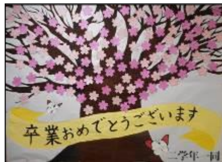
メッセージで満開になりました！ 大きな桜の木は、美術部が制作したものです。

また、卒業式・入学式の際に、学年を代表して、式歌の指揮・伴奏、言葉を述べる担当が決まりましたので紹介します。