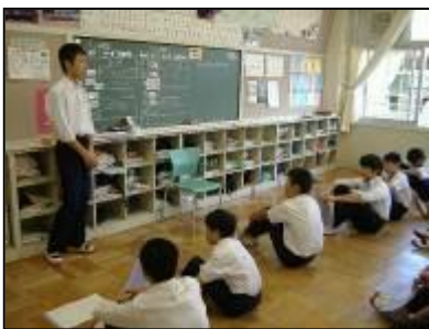
実行委員の話を聞いています

昨年度は「歌う心が見える合唱」ができる学年だと評価していただきました。この1年で様々な経験をし、心も体も成長しているはずです。その成長が、どのような形で表されるのか、本番を楽しみにしたいと思います。