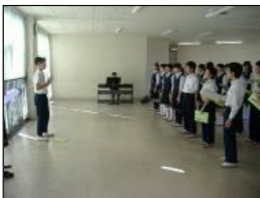
多目的ホールでの練習風景

下の題字は、当日舞台でめぐりプログラムとして使われるものです。4組のN・Sさんが毛筆で書いてくれました。