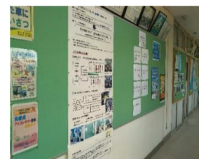
職員室前のパネル掲示

※今回の印刷は(株)小笠原さんのイベントで無料のプリントサービスを利用させていただきました。