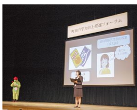
フォーラムの様子

町田市教育委員会は2013年度に学力向上推進委員会を設立。 第1回のフォーラムは2015年5月に開催され、今回が2回目。 第3回は2018年度末～2019年度初の予定です。 当日は市立学校の学力状況の報告から始まり、協同的探究学習を取り入れた模擬授業を実施。観客が生徒役になり、一般的な指導方法による授業と、『協同的探究学習』の授業を比較しながら進められました。 中学社会科(公民分野)の需要と供給の働きについて、一般的な指導方法の模擬授業では、「ここは重要だから覚えておいてください。」と解答を導き出し、最後は先生の言葉でまとめられて授業が終わりました。 『協同的探究学習』の模擬授業では、身近な食品のイチゴを取り上げ、季節による値段の違いについて、まず深く一人で考える時間を取り、ノートに自由に記述させた後、様々な考えを発表します。そこではどんな意見も尊重し、受け入れながら授業を展開するという工夫を実践。これを活用し、展開問題として缶ジュースを取り上げ、場所による(街中と山頂)値段の違いについて考えさせ、需要と供給の働きの理解を深めて、授業が終わりました。 具体的な実践研究を重ねる「学力向上推進パイロット校(国語)」として、つくし野小は2年間の指定期間を終えました。学校公開などで『協同的探究学習』の取り組みを参観されたことと思います。市民ホールの受付前には、つくし野小の学校の研究の成果・検証の結果についてのパネルが展示されていました。 今年度からは「学力向上推進協力校」として、学習指導案の発信等を行う予定です。 このパネルは現在、職員室前の廊下に掲示されています。ぜひ先生方の2年間の取り組み、成果をご覧いただきたいと思っております。