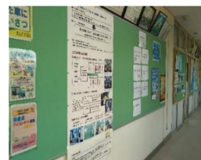
職員室前のパネル掲示

※今回の印刷は(株)小笠原さんのイベントで無料のプリントサービスを利用させていただきました。