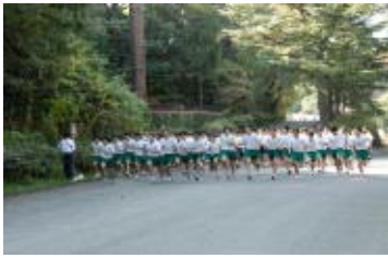
マラソン大会風景(こどもの国)